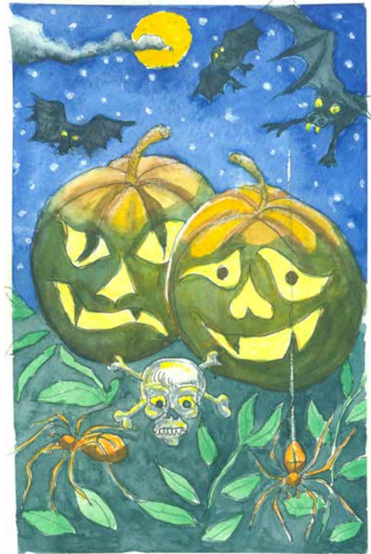
Tegning: Per Tjørnild