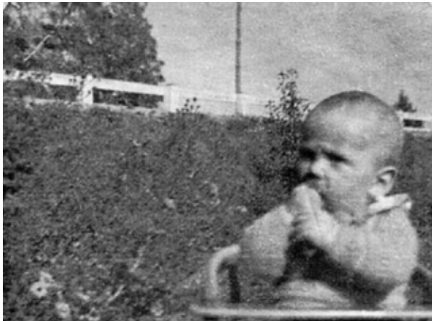
Her er det undertegnede i 1948, og autoværnet langs "dæmningen" i baggrunden.