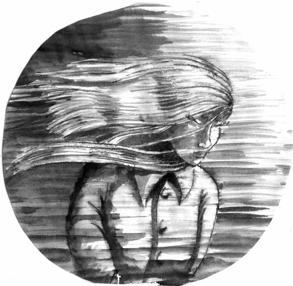
Tegning: Per Tjørnild