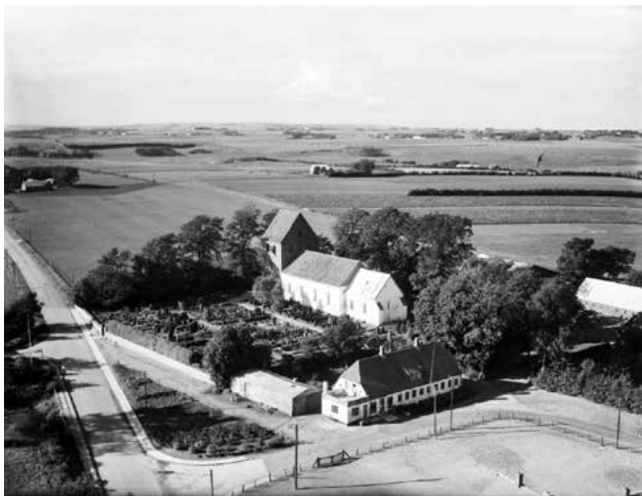
Billeder fra dengang findes ikke, men her er Det Kgl. Biblioteks billede fra 1951.