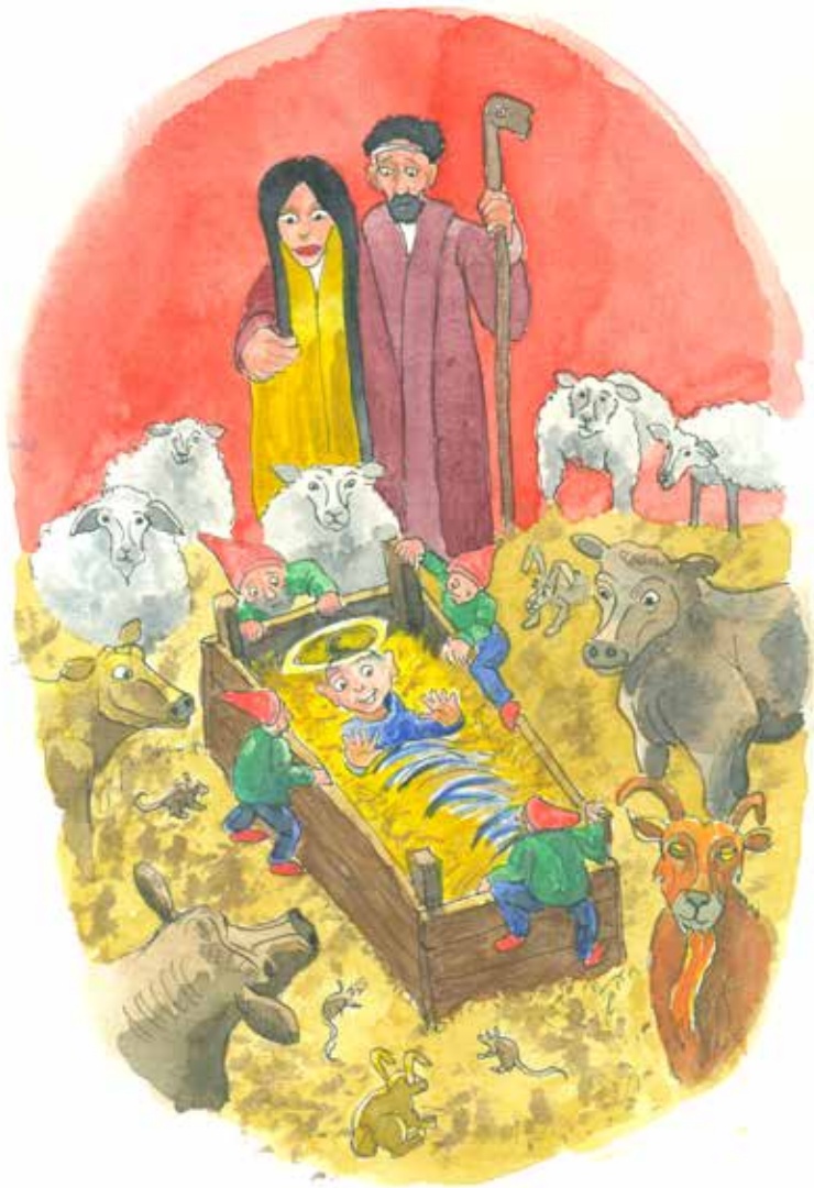
Tegning: Per Tjørnild