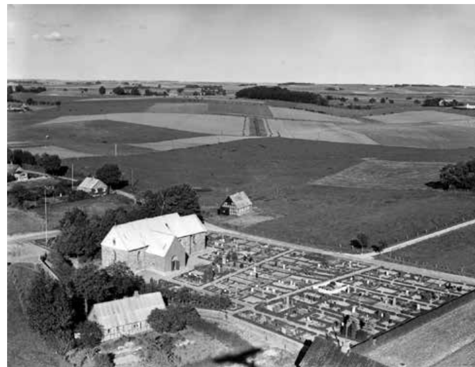
Også et billede fra 1951.

hvorfor høvdingen selvfølgelig har ofret mest på disse, også efter opdyrkningstiden, medens Haslund, Ølst, Værum, Ørum, Laurbjerg, Lerbjerg, Vissing, Rud, Hadbjerg og Halling kirker alle er bygget af kampesten i opdyrkningstiden, og er således 900 år gamle.