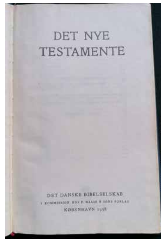
Min udgave af Det Nye Testamente fra da jeg gik til præst.

Dengang var der jo ikke adgang til mange oplysninger, udover dem man hørte i skolen,