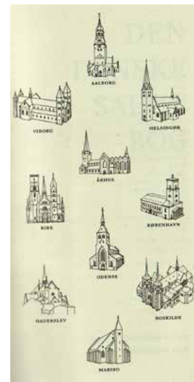
Her ser vi bladet fotograferet fra salmebogen.

og hvis der var blevet fortalt om domkirkerne i skolen, må det have været en dag, jeg har været syg. Og de nyheder, der kom i radioen på program 1 og i avisen Randers Dagblad, ja her reklamerede de ikke meget med domkirker.