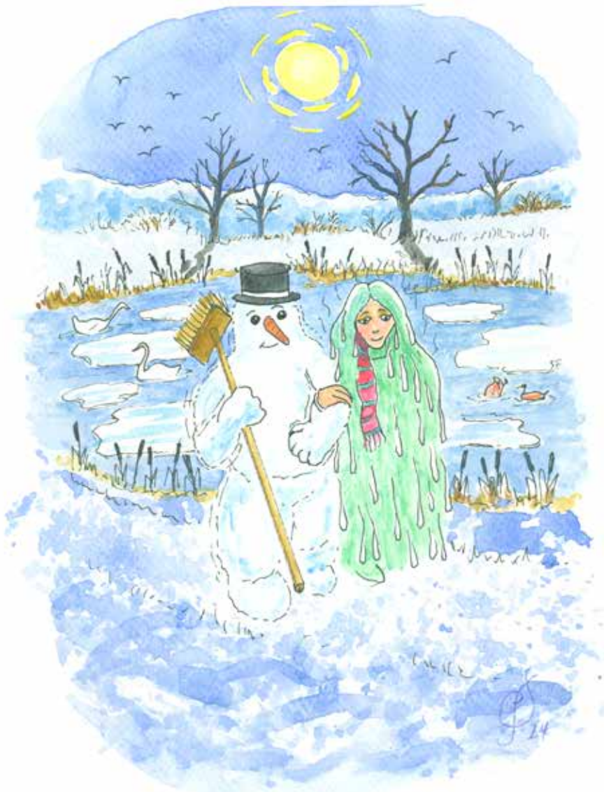
Tegning: Per Tjørnild