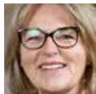
MK Mette Krabbe