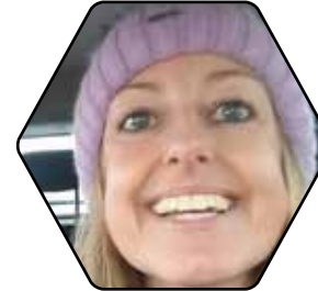
SANNE WITTRUP UDLEJNING AF FORSAMLINGSHUSET

Læs referatet fra årets generalforsamling i Hadbjerg Borgerforening på side 32.