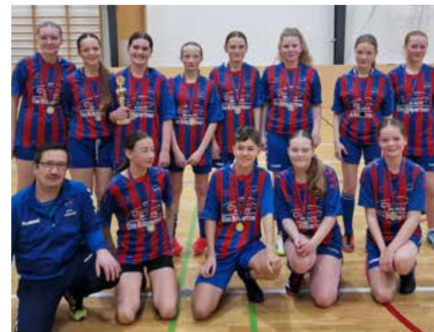
HØST IF U15 PI

Stor tak til alle, der bidrog til en fantastisk weekend.