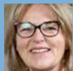
MK Mette Krabbe