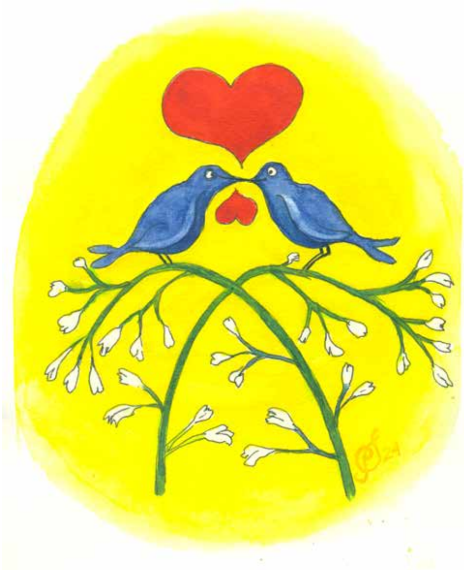
Tegning: Per Tjørnild