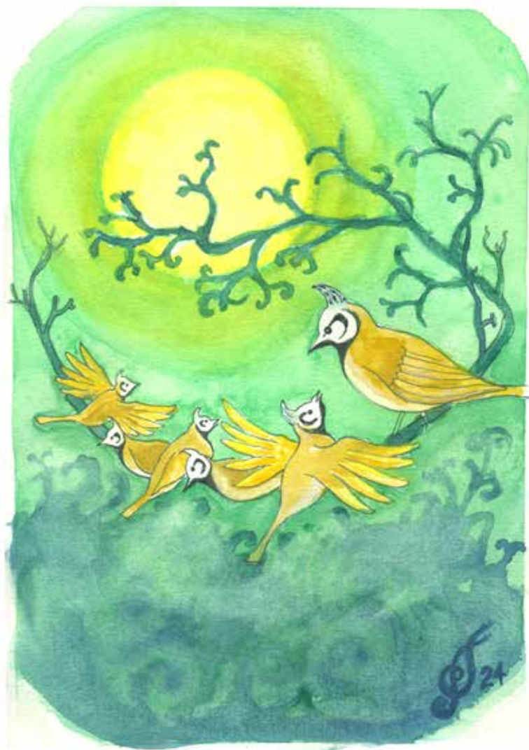
Tegning: Per Tjørnild