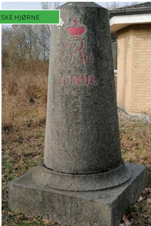
Her ser vi den genfundne sten i god behold.