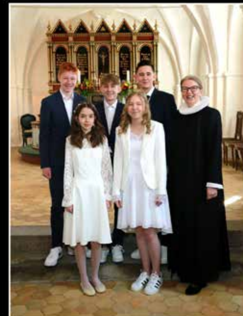
Ødum Kirke d. 27. april 2024

En og en og sammen bevæger vi os afsted i en lang kæde der udgøres af en hel menneskehed. Tak, Gud, fordi der i kæden nu er dette stærke led af piger og drenge der betyder mere end de aner og ved. Det er vores lykke at vi har nogen at elske, nogen at holde af, og vi beder dig: Lad dem gå ud i livet med styrke til at være og lyst til at leve hver eneste dag.