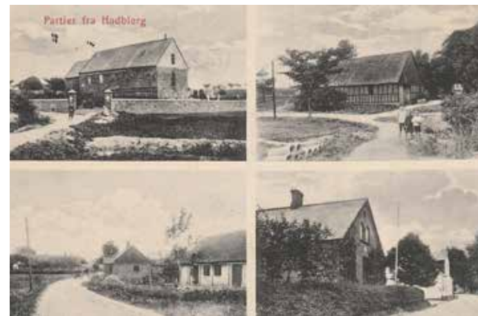
De to øverste postkort er udlånt af Kurt Villy Svendsen