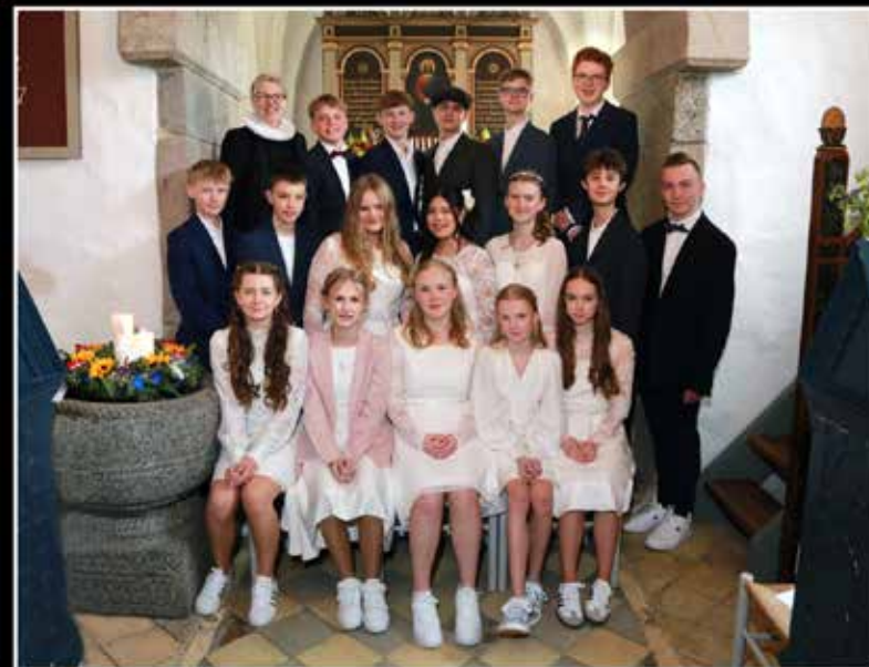
Hadbjerg Kirke d. 27. april 2024