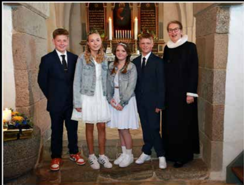
Hadbjerg Kirke d. 26. april 2024