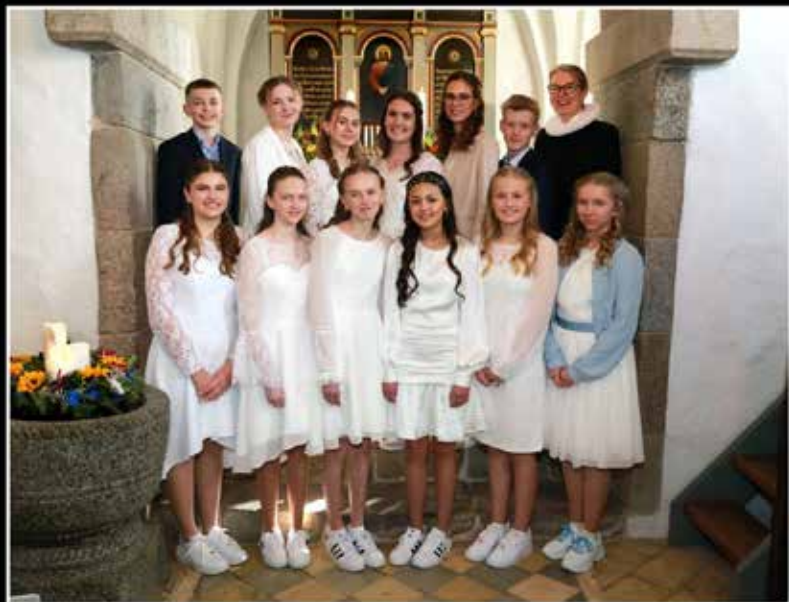
Hadbjerg Kirke d. 27. april 2024