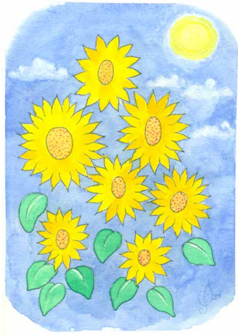
Tegning: Per Tjørnild