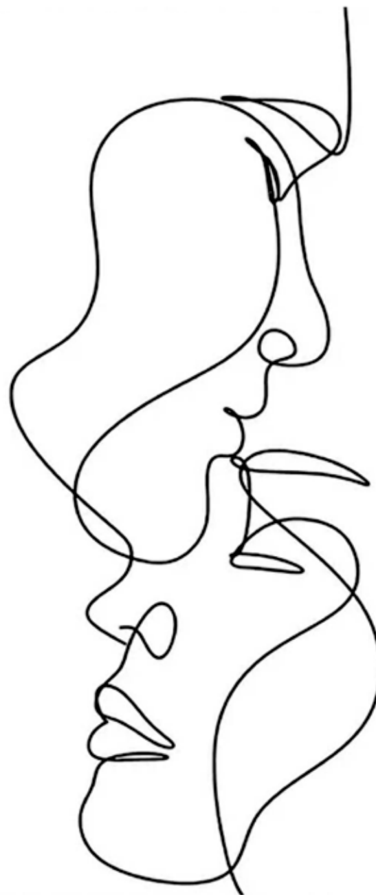
Tegning: Bianca Van Dijk, Pixabay