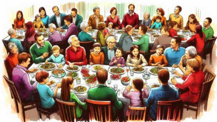
AI: Microsoft Designer