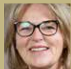
MK Mette Krabbe