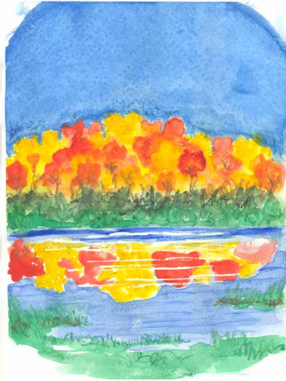
Tegning: Per Tjørnild