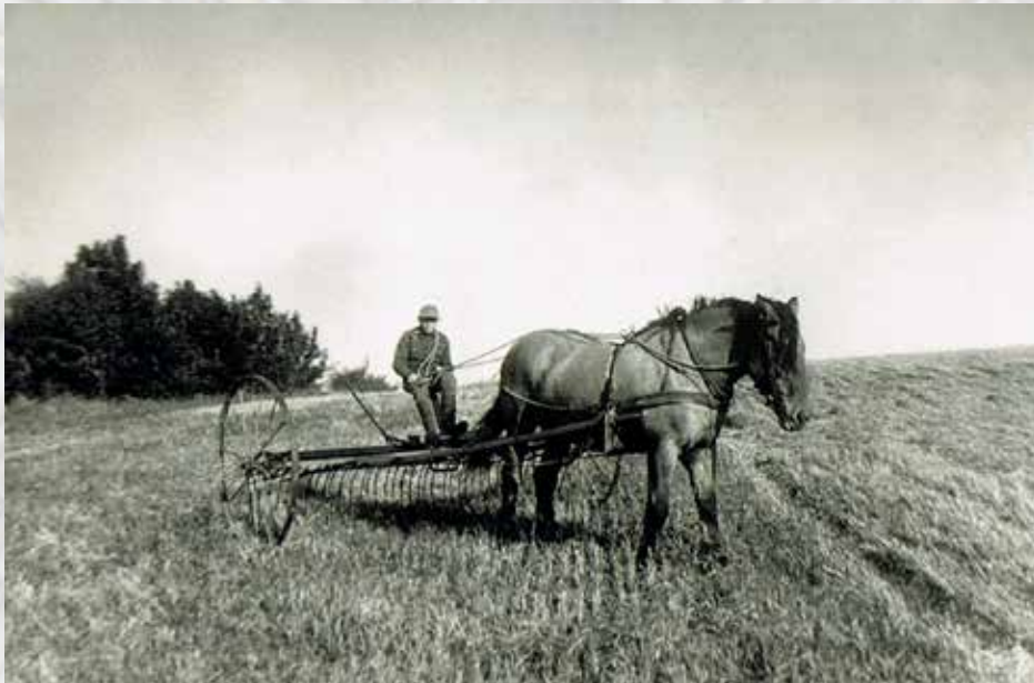
Efter at kornet er kørt ind, skal der rives. Her er det undertegnede, der river marken.

stak bag laden, skulle så køres ind på loftet over kostalden, loftet over hestestalden og loftet over svinestalden, og i løbet af vinteren når laden med tærskværket var tømt, ja så tog vi fat på den anden lade, læssede negene på vogn og kørte det ned til laden med tærskværket, og det hele gentog sig.