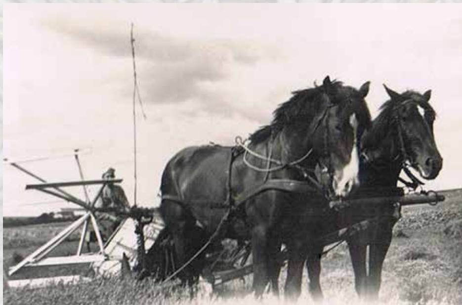
Her er det et billede fra min mors billedalbum.

så det kunne tørre, inden det skulle køres ind.